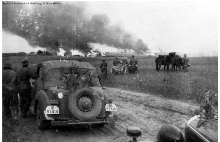
Russland 1941: Bei ihrem Rückzug hinterließen die Sowjetsoldaten oftmals "verbrannte Erde". Gleise und Brücken wurden gesprengt, ganze Dörfer abgefackelt. Nichts sollte dem Feind in die Hände fallen. Eine Taktik, die auch von der Wehrmacht angewandt wurde, als sie sich aus Russland zurückziehen mußte.

Zu dieser Zeit hatten wir einige Mitglieder unserer Einheit verloren und andere wurden krank, es war also eine sehr harte Zeit. Unsere Führer taten gut daran, mit uns draußen zu bleiben, um zu zeigen, dass sie unsere Lasten trugen und sich nicht versteckten. Es wurde so kalt, dass es ein paar Wochen lang ruhig war. Jede Seite wollte nur warm bleiben und das brutale Wetter überleben. Ich habe sogar von einem Bericht gehört, in dem sowjetische Soldaten in einer ruhigen Gegend gegen Gegenstände getauscht haben. Ich habe das nie gesehen, aber ich konnte es mir vorstellen. Wie ich bereits erwähnte, wurde ich verwundet und musste deshalb nach Hause zurückkehren, was zu einem Trainingskurs führte, der eine Weile dauerte, bis ich aufgetaut war.