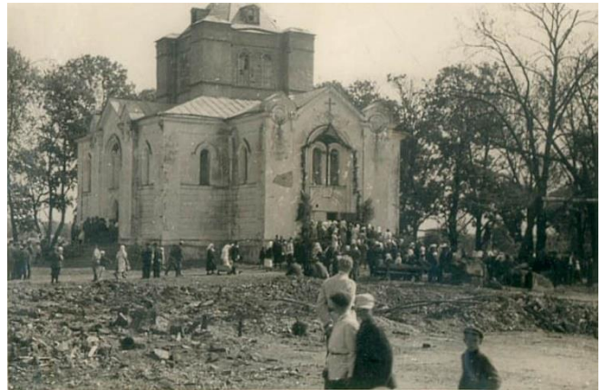
Ein Beispiel aus Weißrußland, die Kirche von Koidanov:

Die moderne Kirche des Schutzes der Heiligen Maria wurde nach dem Projekt der Provinzbaukommission von 1845 - 1850 gebaut.