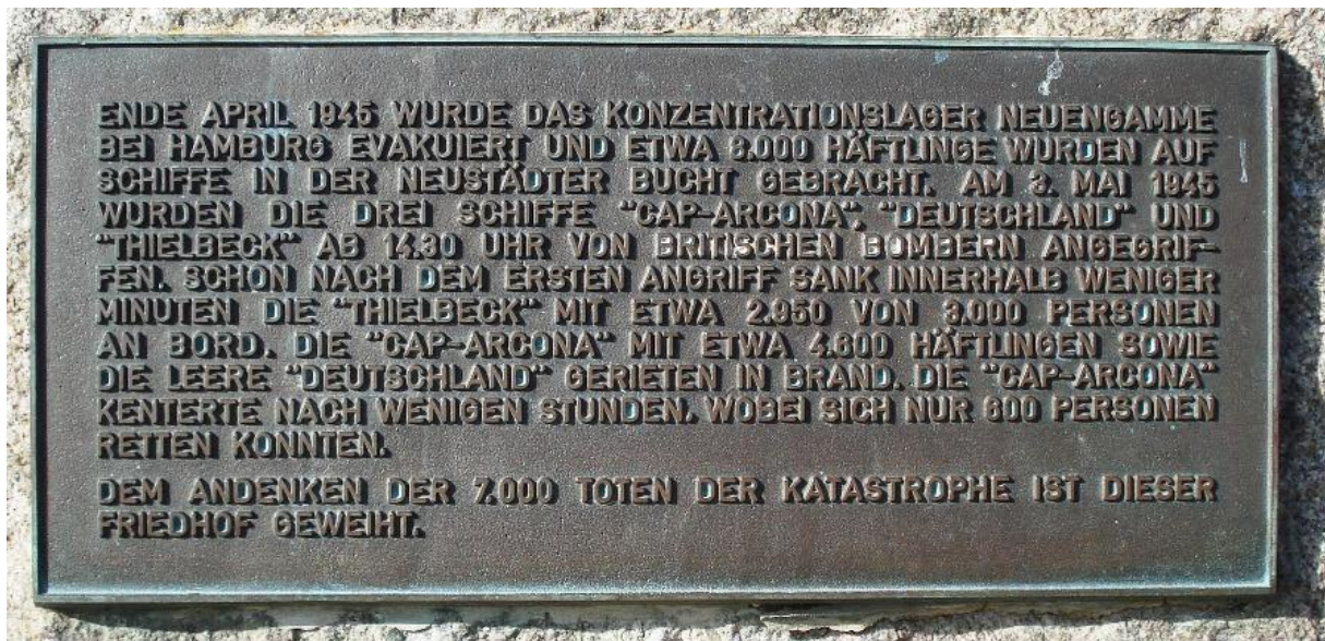
Erinnerungstafel an den Untergang der Cap Arcona und der Thielbek auf dem Ehrenfriedhof Cap Arcona bei Neustadt

Pilot, der Menschen aus dem Kessel flog und abgeschossen wurde. Ich zählte zu den Glücklichen, da ich es nach draußen schaffte, um behandelt zu werden und den Krieg in einem Krankenhaus beendete.