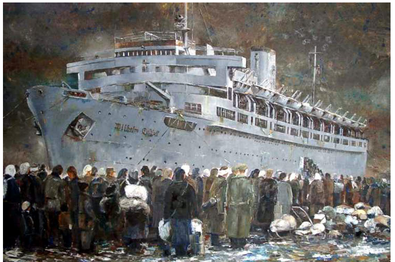
Gemälde der „Wilhelm Gustloff“ in Gdyniahafen Unternehmen „Hannibal“

Dietrich: Ahh, nicht viele Menschen außerhalb Deutschlands kennen diesen Namen. Sie wissen, dass dieses Schiff von einem sowjetischen U-Boot versenkt wurde und den größten Verlust an Menschenleben in der Geschichte der Schifffahrt darstellt [am 30. Januar 1945 kamen bei diesem rücksichtslosen Angriff rund 10.000 Menschen, zumeist Zivilisten, ums Leben]. Ich kann mich kaum noch an diese Zeit erinnern, aber ich weiß noch, wie unzählige Menschen, Militärs und Zivilisten, versuchten, zu entkommen. Die Sowjets hatten uns in der Falle. Die Kriegsmarine hatte alle ihre Schiffe nach Ostpreußen verlegt, um uns unglückliche Seelen zu evakuieren. Es handelte sich um ein riesiges Gebiet, in dem einige Reste von Divisionen die Rote Armee aufhielten. So konnten viele Millionen sicher ins Reich gebracht werden. Das Schiff war mit vielen Tausenden von Seelen beladen. Von seinem Untergang erfuhren wir erst nach dem Krieg, es war eine Tragödie ohnegleichen. Die Sowjets wussten, dass wir Zivilisten evakuierten, die man aus Barmherzigkeit hätte verschonen sollen. Sie nutzten die traurigen Zeiten aus, nur um einen Mord zu begehen, eine Schande.