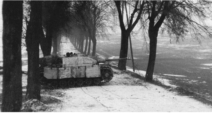
Ostpreußen, 1945 StuG III Ausf G, bereitet sich auf den Kampf vor.

ich 1945 bereits beide Klassen. Meine Auszeichnung kam spät im Krieg, wir kämpften im Osten, zogen in die baltischen Staaten und dann zurück ins Reichsgebiet. Inzwischen war ich bei der Langwaffe und war sehr erfolgreich darin, sowjetische Panzer auszuschalten. Wir wurden als Truppe eingesetzt, um von einem heißen Ort zum anderen zu ziehen. Wir nannten uns Feuerbrigaden, da wir schnell dorthin gingen, wo ein Durchbruch stattgefunden hatte. Wir gingen zum Gegenangriff über, drängten den Feind zurück und zogen dann weiter zum nächsten Ort.