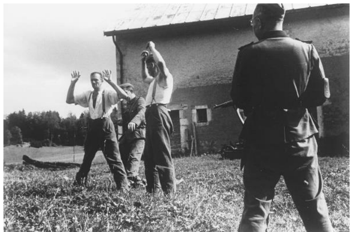
Nach einer handschriftlichen Beschreibung stellt das Foto die Gefangennahme von Wehrmachtsdeserteuren 1944 im Westen dar. In der Regel wurden sie zum Tode verurteilt

Dietrich: Ahhh, da bin ich vorsichtig, mein Junge. Ich habe Ihnen gesagt, dass ich nichts dergleichen gesehen habe und mich in einem solchen Fall auflehnen würde. Ich würde vielleicht sagen, dass die Veteranen die Geschichten ausschmücken. Auch ich habe in unseren Zeitungen Berichte über Ihre Soldaten gelesen. Ein Artikel, der mir ins Auge fiel, war die Behauptung eines Soldaten, deutsche Soldaten würden auf zurückweichende Kameraden schießen. Das ist in meinen Augen falsch, denn ich habe den Krieg erlebt. Es gab Zeiten, in denen der Rückzug die einzige Möglichkeit war, ein Kommando oder eine Einheit zu retten. Das geschah sehr oft, damit eine neue Kampflinie gebildet werden konnte. Es ist lächerlich, dass er das gesagt hat. Er hätte sagen sollen, dass Deserteure in Kriegszeiten von allen Armeen erschossen werden.