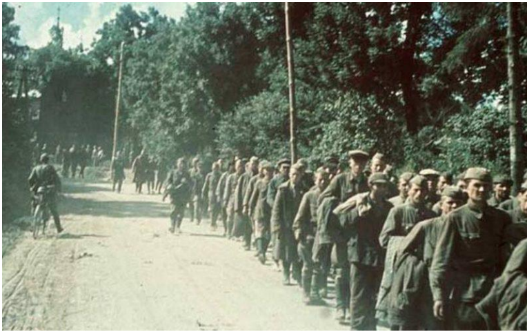
Kriegsgefangene der Roten Armee. Sommer 1941

auch große Nachschubstützpunkte mit viel Treibstoff und Waffen. Die erste Angriffswelle hatte ihre Linien durchbrochen und sie entweder zur Kapitulation oder zum Rückzug gezwungen. Die Zivilisten jubelten uns zu, als wir gefangene Soldaten nach hinten brachten. Ich dachte mir, dass dies eine leichte