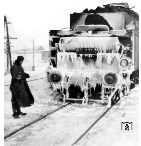
Vom harten Wintereinsatz 1941 ist 55 2758 in der Gegend von Minsk gezeichnet. Bei Temperaturen unterhalb von -20 Grad Celsius war im Winter 1941/42 kein geordneter Eisenbahnbetrieb mehr möglich. So hatte das Bw Minsk einen Lokomotivausfall von bis zu 90 % zu verzeichnen. Die Lok kehrte auch nicht mehr nach Deutschland zurück und wurde im Februar 1951 in der Sowjetunion ausgemustert.

Dietrich: Ja, ich war dort, und wir bekamen eine Medaille für diese Zeit, wir nannten sie die 'Gefrierfleischmedaille'. Und wissen Sie, warum sie so genannt wurde? Weil es so verdammt kalt war, dass uns das Fleisch in der Hose gefror. Man musste sich mit allen möglichen Lumpen oder anderen Dingen ausstopfen, die man finden konnte, um sich warm zu halten. Zum Glück hatten wir unzerstörte Dörfer in der Nähe unserer Linien und die Menschen halfen, uns warm zu halten. Bei Temperaturen von bis zu -40 Grad mussten wir hinausgehen und Feuerholz sammeln. Auch der Wachdienst musste eingeschränkt werden, denn manchmal war es so kalt, dass Wasser in der Luft gefror, wenn es geworfen wurde. Ich habe einige Soldaten gesehen, die sich Erfrierungen zuzogen, weil sie ihre Socken abgenutzt hatten oder keine warme Kleidung trugen. In einem traurigen Fall sah ich sogar, wie unsere Männer warme Kleidung von