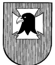
Kennzeichen der Sturmgeschütz-Brigade 259