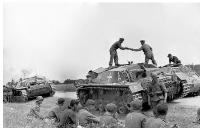
Stug III, Heeresgruppe Nord, Vormarsch durch Lettland, Sommer 1941