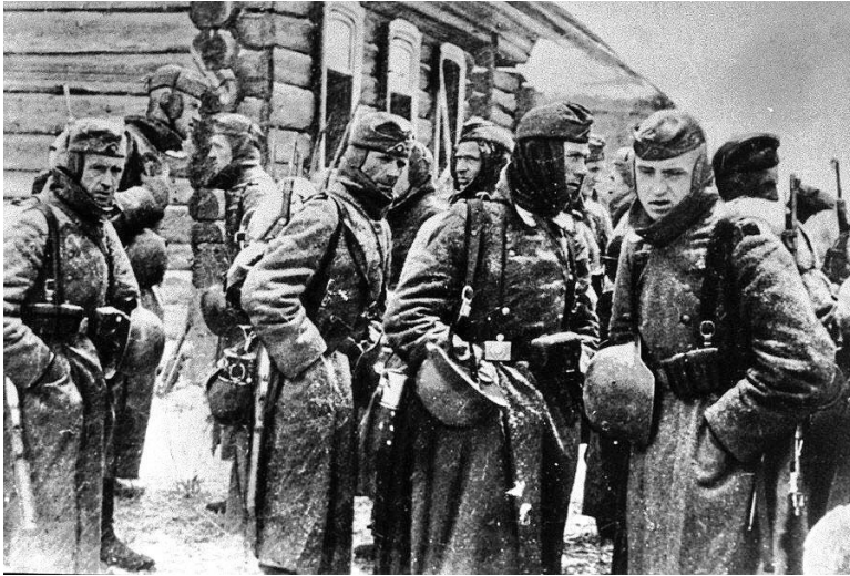
Deutsche Soldaten warten frierend auf Befehle während des deutschen Vormarschs Richtung Moskau im Bereich der Heeresgruppe Mitte.

einem Dorf, in dem wir waren, übernachteten wir in der Garage eines Mechanikers. Er hatte einen großen selbstgebauten Ofen, der die Wohnung sehr gut wärmte.